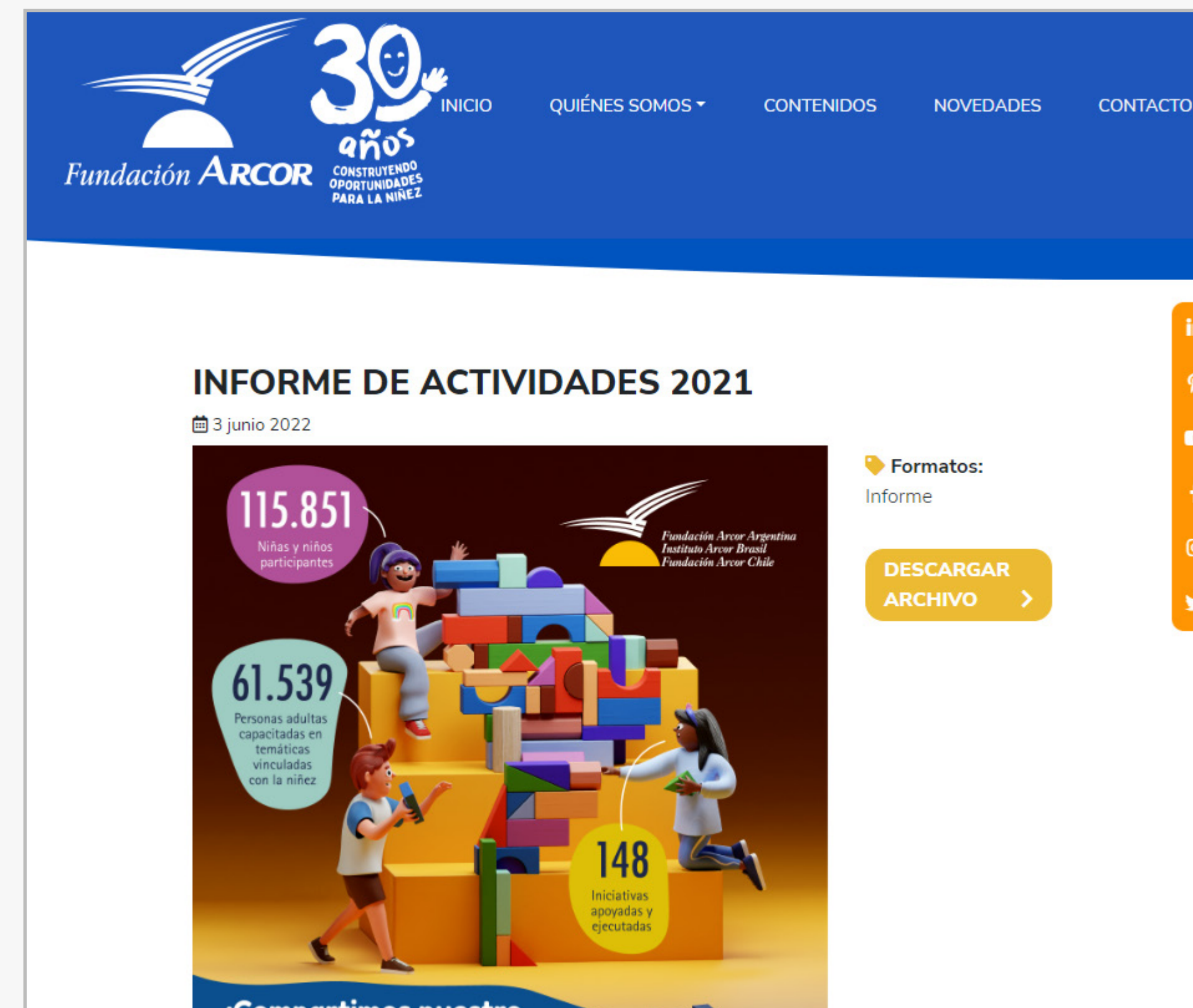
Informe de Actividades 2021 (Archivo PDF para descargar)